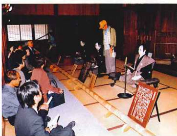
▲面番所内(関所役人)