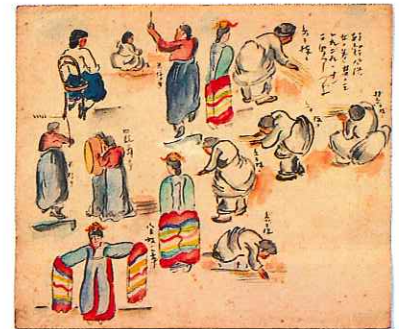
▲朝鮮風俗 女の巻 其ノ三