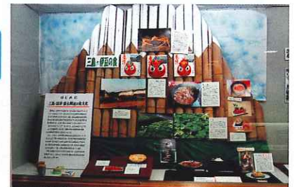
▲三島・伊豆の食文化

展示を通じかつての味覚を思い起こしながら、現在の食の問題、またこれからのあり方を考える端緒となったと思います。