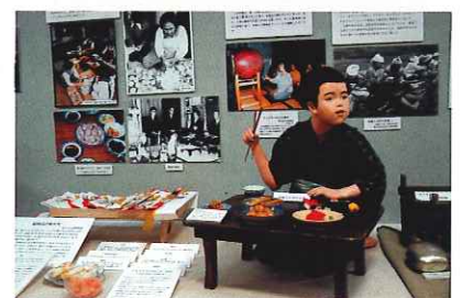
▲祝いごとの食文化