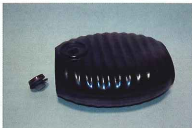
▲陶製湯たんぽ(昭和初期)