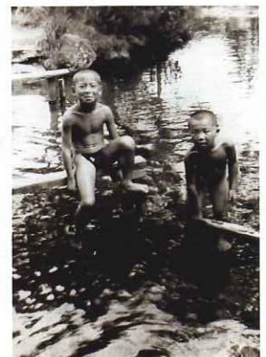
▲甥の野口兄弟 (泉町、芝本町の広瀬付近)