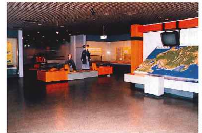
▲本陣資料館展示館