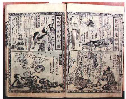
▲曲亭馬琴『夢想兵衛胡蝶物語』