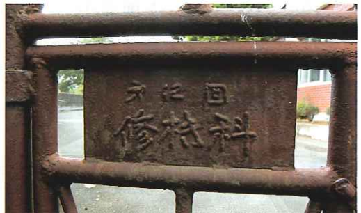
▲旧連隊の門に残る部隊の表示