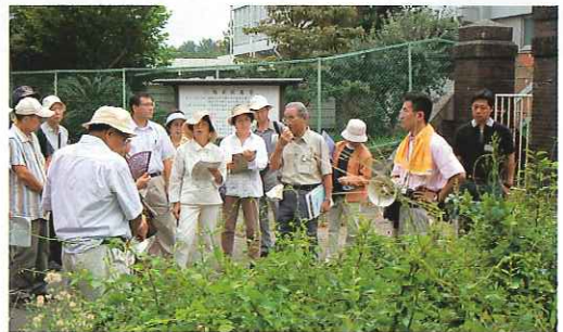
▲北小学校の旧連隊の門と歩哨塔にて