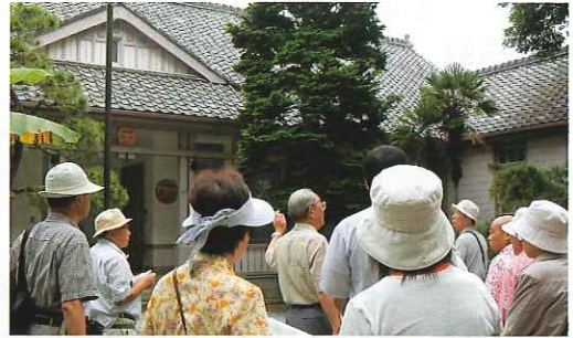
▲野戦重砲兵連隊旧将校集会所(日本大学)にて

戦争の遺跡を忌避して取り払うだけでなく、過去の遺産として残して次世代に語り継いでいくことも大事なことの感想が、参加者から寄せられました。