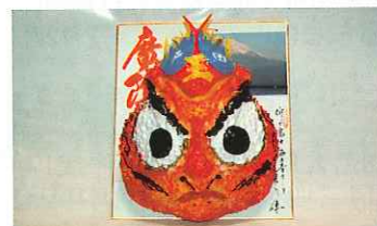
▲旧戸田村のタカアシガニ魔除面