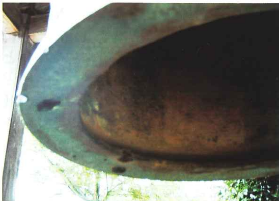
▲「幸運の鐘」に残る弾痕