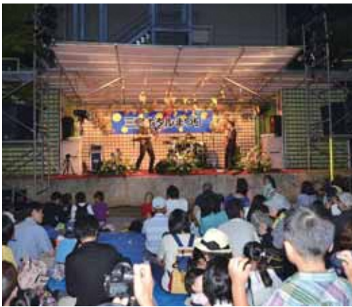
H27年度の三島ホタルまつりの様子 (会場：楽寿園)

その中でも、楽寿園と源兵衛川を会場として行われる三島ホタルまつりでは、源兵衛川（いずみ橋～広瀬橋）がホタルを見るために上流から下流への一方通行になります。また、楽寿園をメイン会場に、売店や音楽の演奏が行われます。クライマックスはチャンスが二度ある抽選会で、最後にホタルを放すと来場者から歓声が上がります。三島駅から数分という近いところでホタルまつりが行われるため、県内外からのお客様も多く、賑やかな一夜となります。