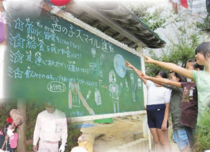
西の子スマイル運動 (西小学校)