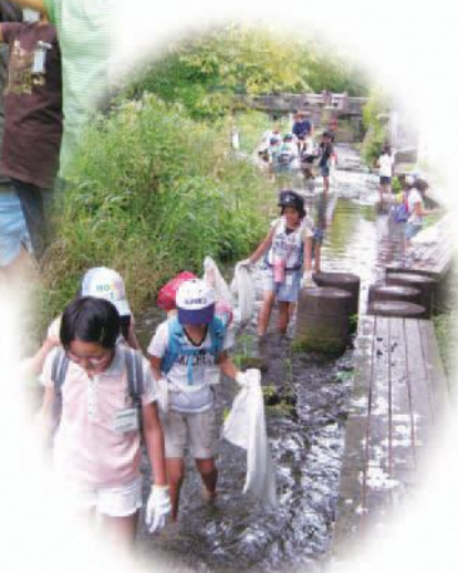
小学生環境探偵団