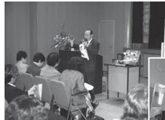
中郷女性学級環境講座