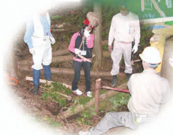
箱根西坂いきいき森づくり