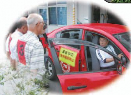
エコドライブ講習