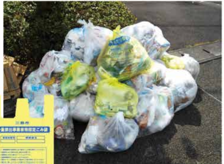
〔10月1日からの集積所のイメージ〕