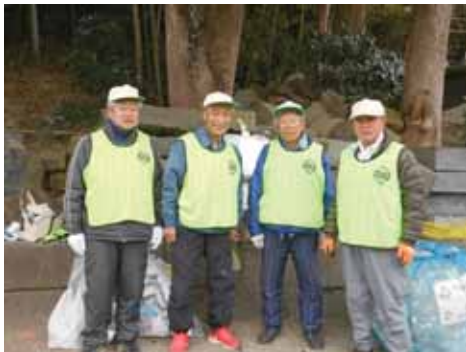
徳倉第3町内会 環境美化推進員のみなさま

住民のみなさまが心地よく暮らせるように、また、ごみを排出する者の責任として日々活動しています。