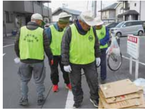
ごみ集積所の巡回の様子 4名で町内の集積所を巡回しています。

資源ごみの日に、缶の入れ物の中にスプレー缶が入っていたり、その他の燃えないごみの中に刃物が入っていることがあります。