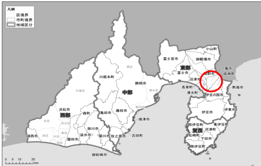
図 1.1 三島市位置図