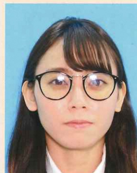
照明が眼鏡に反射したもの