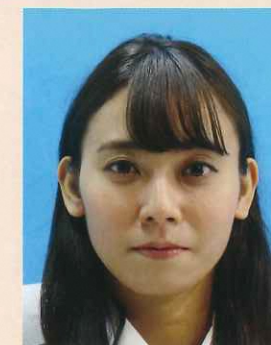
背景に異物が写りこんでいるもの