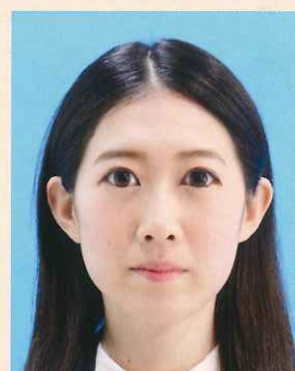
目を大きくしたり、顔のパーツが変形したもの

目を大きく見せたり、美白処理、顔パーツやほくろ、しわなどを修正するなどして、本人のイメージを変えることは、いかなる場合でも不適当です。また、左右反転※した写真は不適当です。