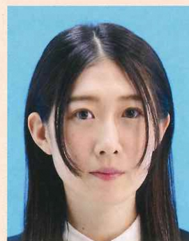
髪が目にかかっているもの