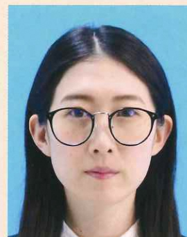
眼鏡のフレームが目にかかっているもの