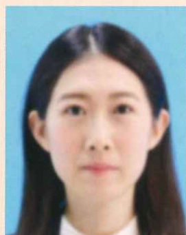
ピンぼけや手ぶれにより不鮮明なもの

撮影時にピントが合っていないかったり、手ぶれしてしまったため不鮮明なものや、顔にてかりやムラがあるものは不適当です。