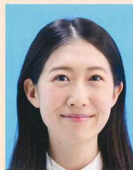
口角が上がるなどにより実際の容姿と著しく異なるもの