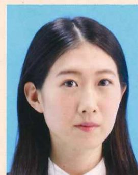
横を向いているもの