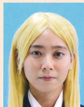
カツラ(ウィッグ)などにより実際の容姿や雰囲気が変わるもの