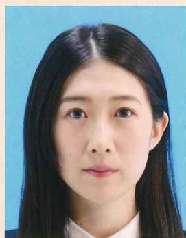
顔の輪郭が隠れるもの