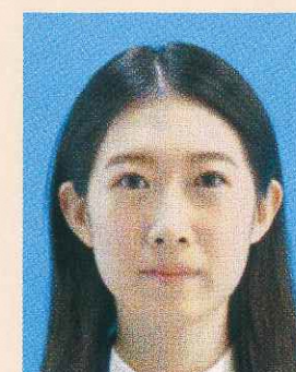
ドット(網状の点)やインクのにじみがあるもの