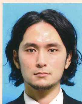
てかりやムラがあるもの