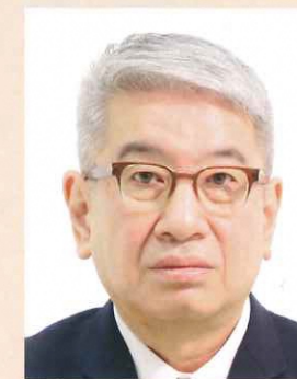
頭、髪、服装等と背景の境界が不明瞭なもの