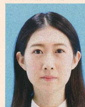
ノイズ(画像の乱れ)があるもの

デジタル画像の過剰な圧縮などが原因となってノイズ(画像の乱れ)が発生しているものや、ジャギー(階段状のギザギザ模様)、印刷時のドット(網状の点)やインクのにじみがあるものは不適当です。写真専用の用紙を使用し、鮮明な画質で印刷してください。