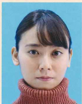
タートルネック、パーカーのフード、首を覆うもの、衣服などにより顎などの顔の一部が隠れているもの