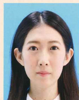
変形やマスクングなどの画像処理をほどこしたもの