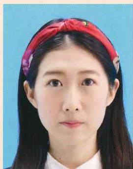
帽子やヘアバンドなどにより頭部が隠れているもの