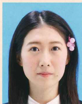
装飾品で目・耳・鼻・唇などが隠れているもの