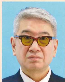
色付きの眼鏡やサングラス

より確実な本人確認のため、眼鏡を外した顔写真を推奨します。眼鏡を着用するとき、色付きのレンズや反射・影があるものは不適当です。また、目を妨げる縁・フレームがないものに限ります。医療上必要とされない限り、サングラスや処方のない色付きの眼鏡は不適当です。