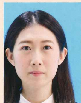
位置が片寄っているもの