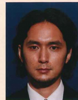
背景の色が濃いもの