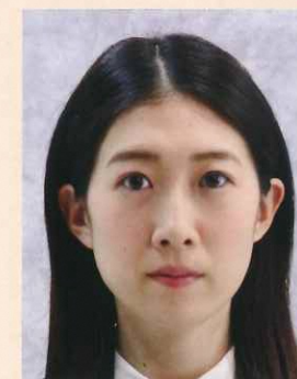
背景が柄模様であったり、凹凸のあるクロスが写りこんでいるもの