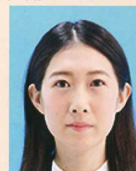
ジャギー(階段状のギザギザ模様)があるもの