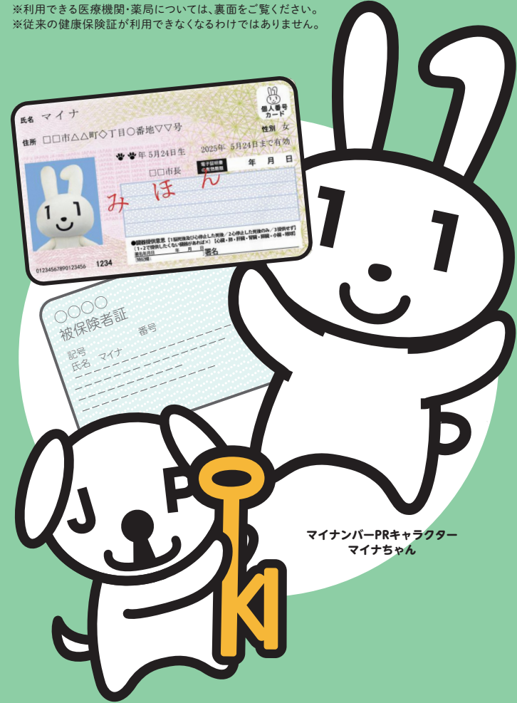
マイナンバー-PRキャラクター マイナちゃん