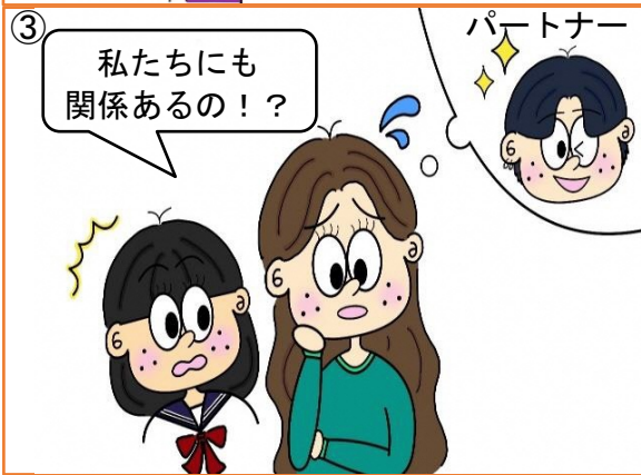
子宮頸がん罹患数 (2019 年)