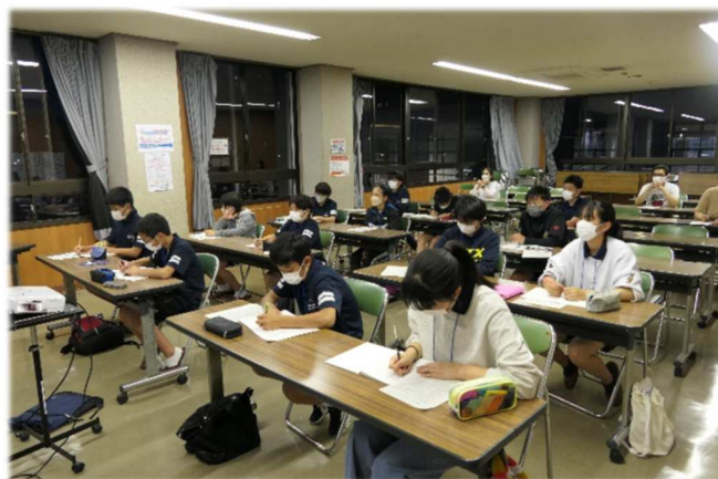
◇ 令和5年6月 ワットバイク測定 場所:三島市民体育館 競技場