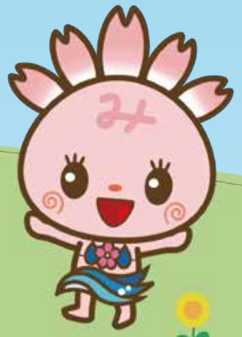
みしまるごちゃん