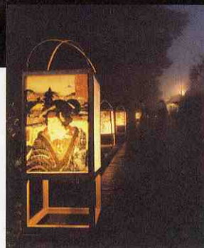
芝切地藏・睡蓮祭り