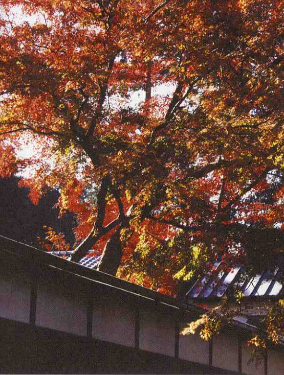
秋の王澤妙法華寺