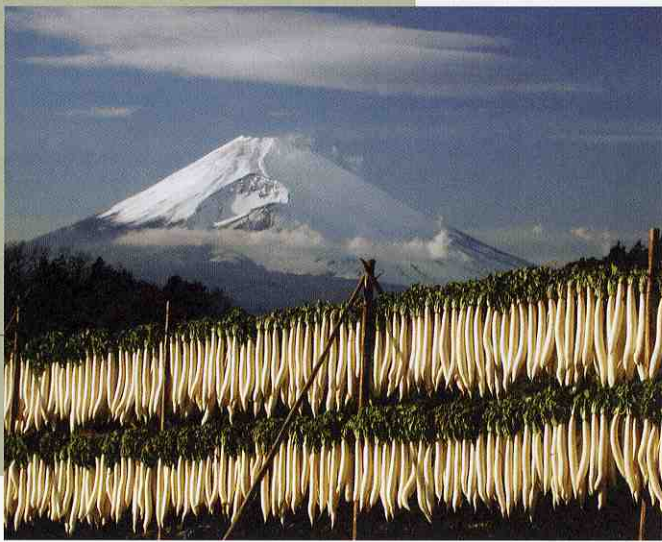
箱根西麓の大根干し