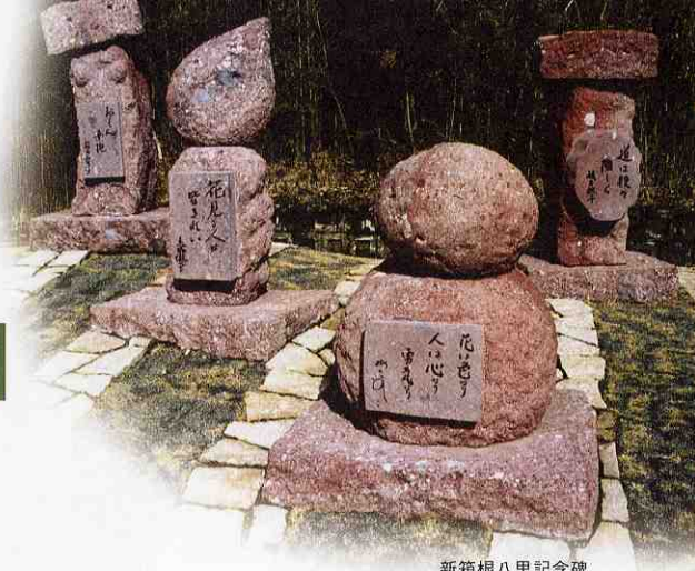
新箱根八里記念碑