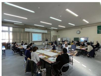
整備計画の概要説明