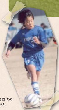
小学校時代のひかりさん