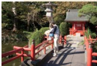
大鳥居と総門の間にある神池にいるコイにエサをやる姿も、春は池の周囲に植えられた桜並木が見事です。

白滝公園にある街の水の仕掛け「めぐみの子」に続き三島商工会議所と三島市との協働により平成19年に作られた「つるべっ子」では三島のおいしい水を街角で気軽に飲むことができます。平成24年に本町交差点から三島市役所総合防災センター前に移設され、市民や観光客の喉を潤してくれています。「めぐみの子」同様、季節ごとに変わる衣装が行き交う人を楽しませます。