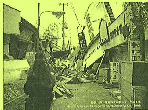
(阪神・淡路大震災から)