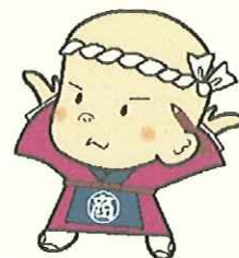
三島商店街連盟 イメージキャラクター あきんどくん