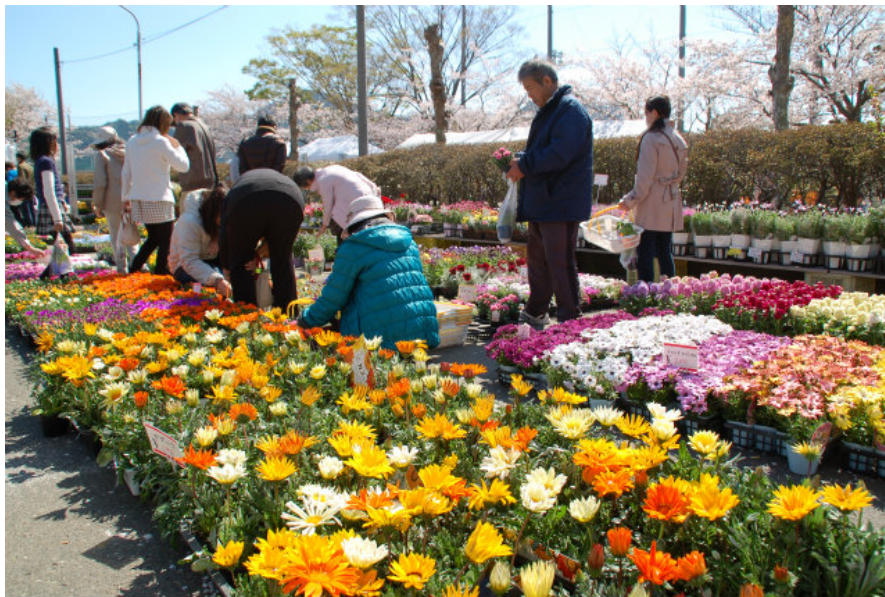
春の三島みどりまつり 4月4日(土)・5日(日)開催