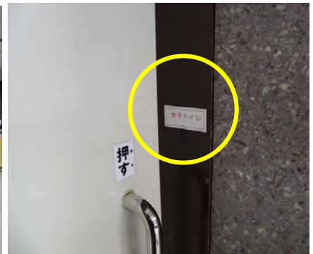
設置方法及び例（庁舎本館1階女子トイレ）