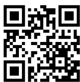
【テストセンター会場】