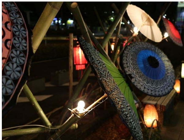
写真は昨年の様子