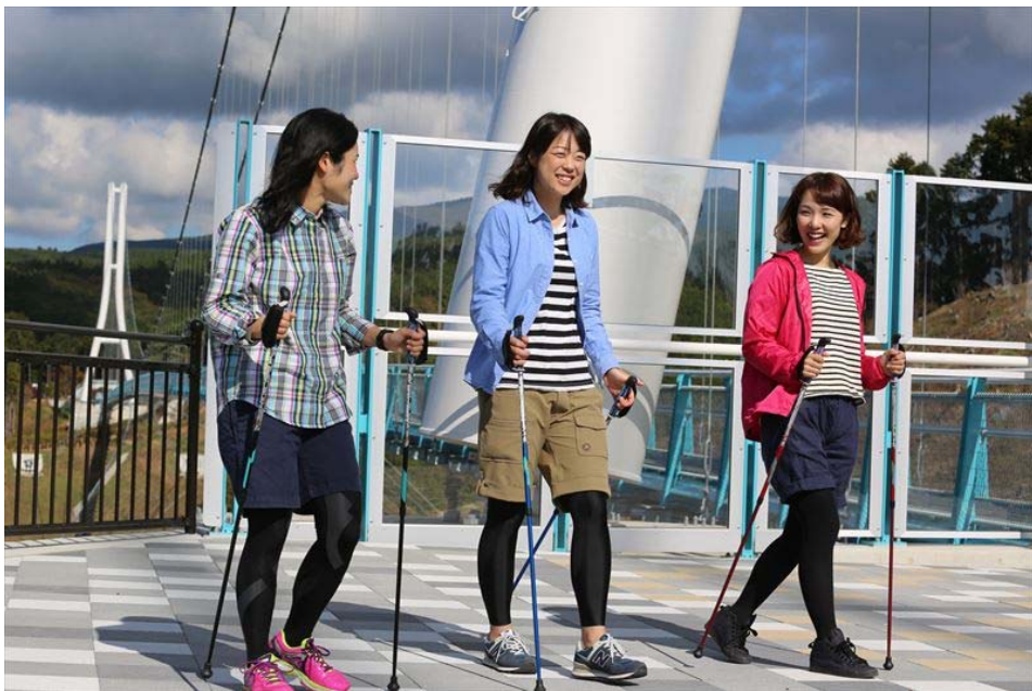
静岡県内初、ノルディックウォーキングコース認定