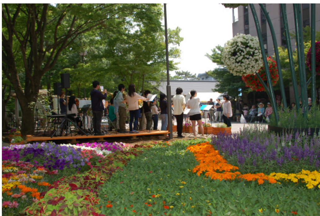
みしま花のまちフェア 5月30日(土)・31日(日)開催