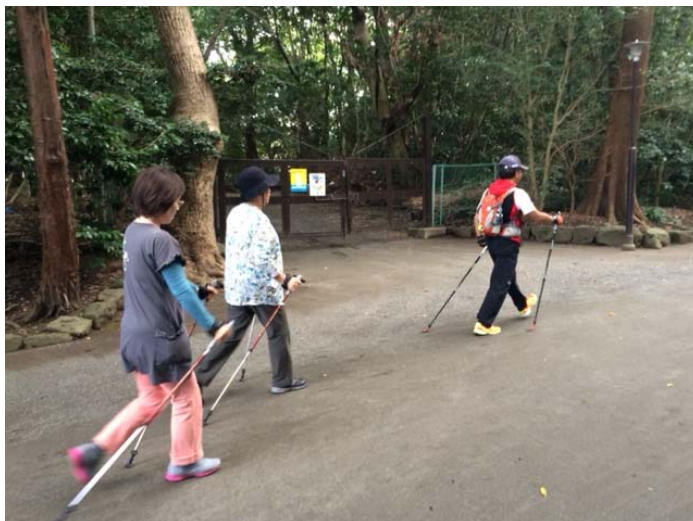
ノルディックウォーキング