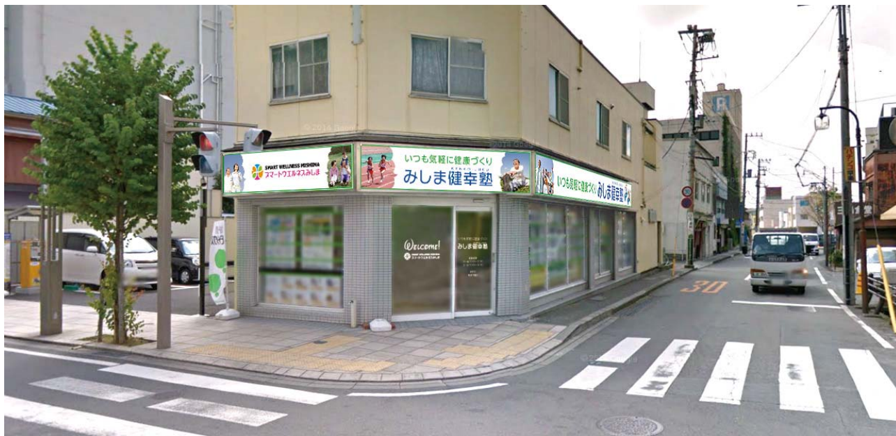
建物外観（イメージ）