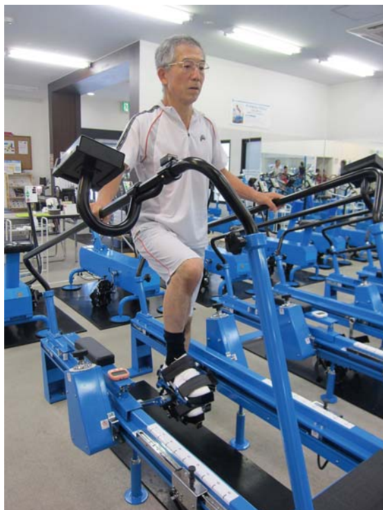
大腰筋トレーニングマシン (スプリントトレーニングマシン)