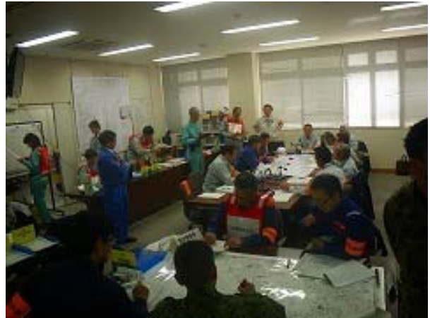
【27 年 2 月に実施した本部情報処理訓練の様子】