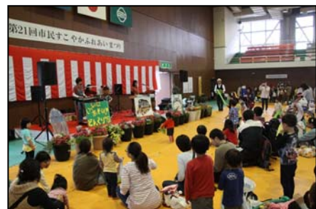
【ステージイベントの様子】

体育館内：ボランティア団体等による活動のPR 福祉施設の紹介・自主生産品の販売など ステージ：ミニライブ・ふれあい抽選会など 模擬店：やきそば・から揚げ・わたがしなど 健康コーナー：測定器を使った体力チェックなど