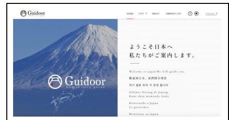
Webサイト「Guidoor」グランドトップページ