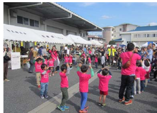
【伊豆佐野保育園児による山北甘藷音頭の披露の様子(H27年度)】