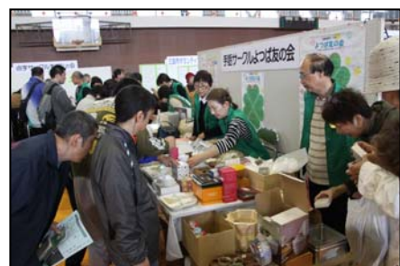
【展示ブースの様子】