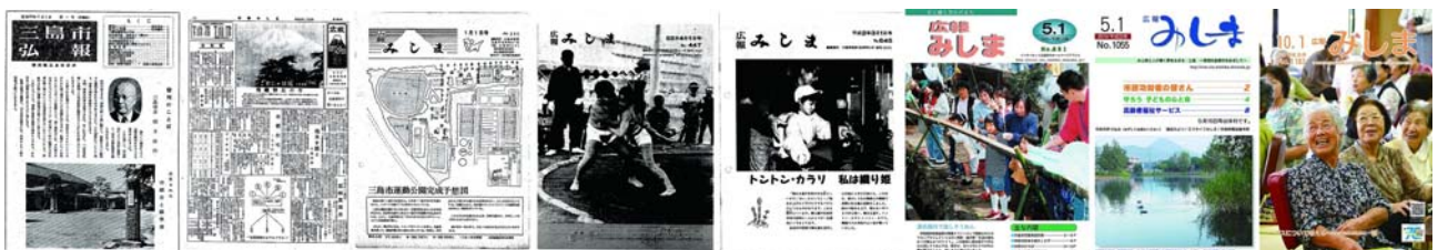
広報みしまの歩み（左から昭和25年・35年・45年・55年・平成2年・12年・22年・28年）

広報みしまのリニューアルに伴い、別冊折り込みの「みしま市議会だより」、「ごみ減量トレンドィ」、「エコライフみしま」等についても、「右綴じ・左開き・縦書き・綴じ穴なし」に変更する。