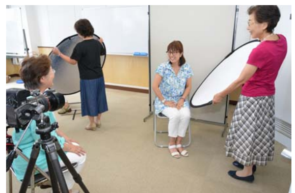
【育成セミナーの様子(写真の撮り方・撮られ方)】