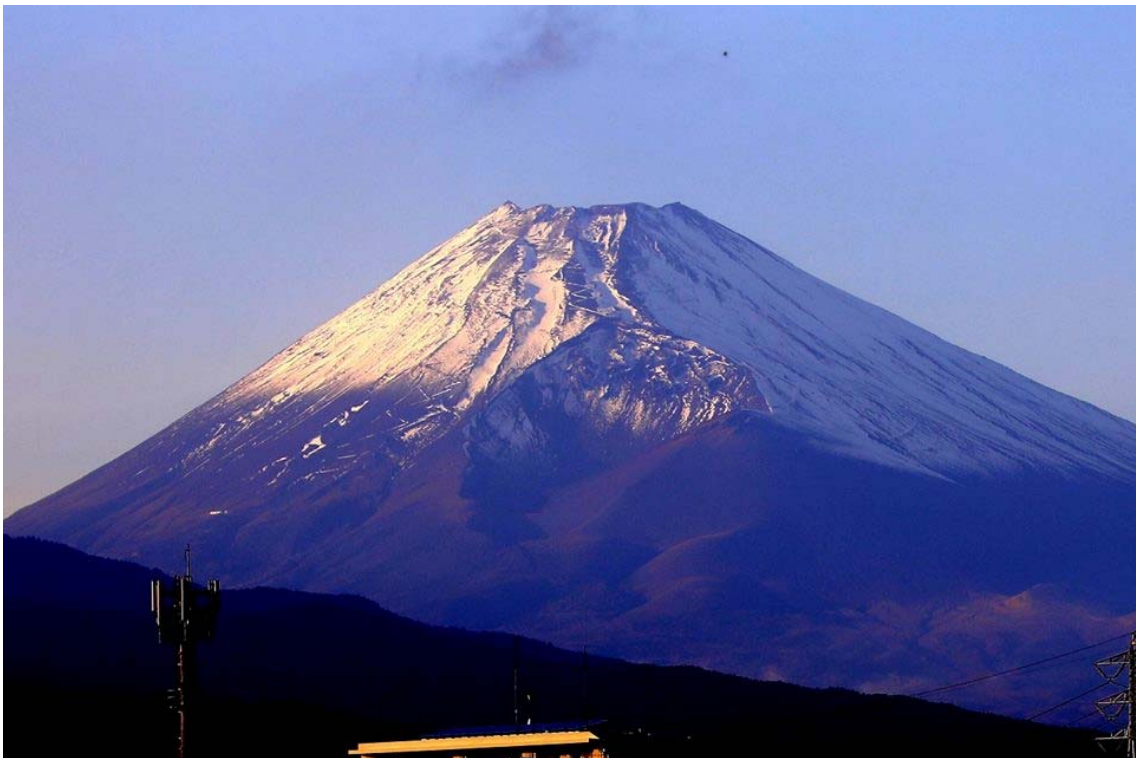
富士山が綺麗に見える季節となりました