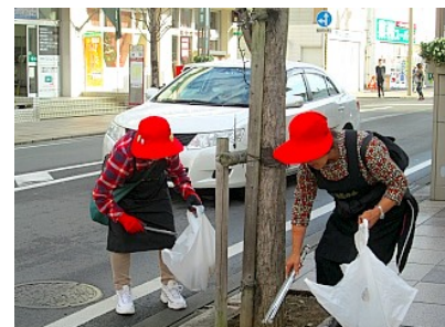
【昨年の清掃の様子】