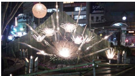
【大型のモニュメント（イメージ）】