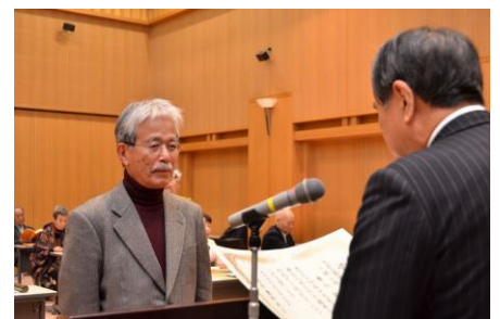
【昨年度の表彰式の様子】