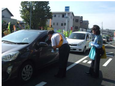
初日一斉街頭広報でドライバーへ啓発品を配布