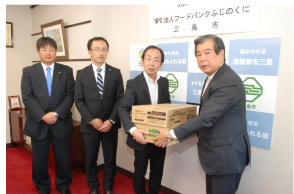
【フードバンクふじのくにへ災害備蓄食料提供】