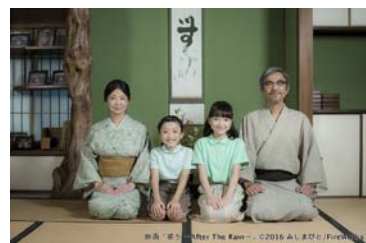
みしまびと映画「惑う」