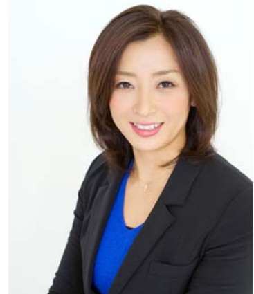
セントラルスポーツ所属 伊藤華英さん

2000年に15歳で日本選手権に初出場。2001年には世界選手権の代表に選出。2006年には200m背泳ぎ、2008年には100m背泳ぎの日本新記録を樹立。2008年北京では、日本代表に選出され、100m背泳ぎ8位、200m背泳ぎ12位という成績を残す。2009年からは背泳ぎから自由形に転向し、400mフリーリレーで日本新記録を樹立。2012年ロンドンでは自由形で日本代表に選出され、400mフリーリレー7位、800mフリーリレー8位という成績を残す。そして、2012年の国体を最後に引退した。引退後は、ピラティス講師の資格取得と共に、水泳とピラティスの素晴らしさを伝えるのと同時に、スポーツの発展、価値向上のために活動中。