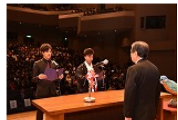
【昨年の二十歳の誓い】