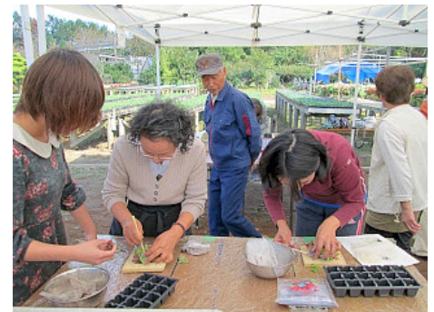
多肉植物寄せ植え講座(イメージ)