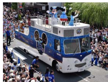
ディズニーシーパレード