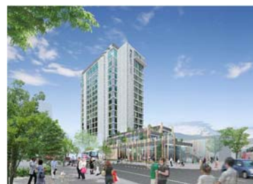
三島駅南口西街区イメージ