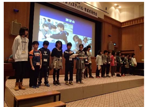
【子ども達による活動発表の様子】