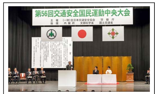
昨年度の第56回大会での大会宣言の様子

また、三島市立山田小学校については、交通安全活動を積極的に推進したことで、過去に静岡県交通安全対策協議会会長表彰を受賞しており、静岡県教育委員会からの推薦で受賞決定がなされております。