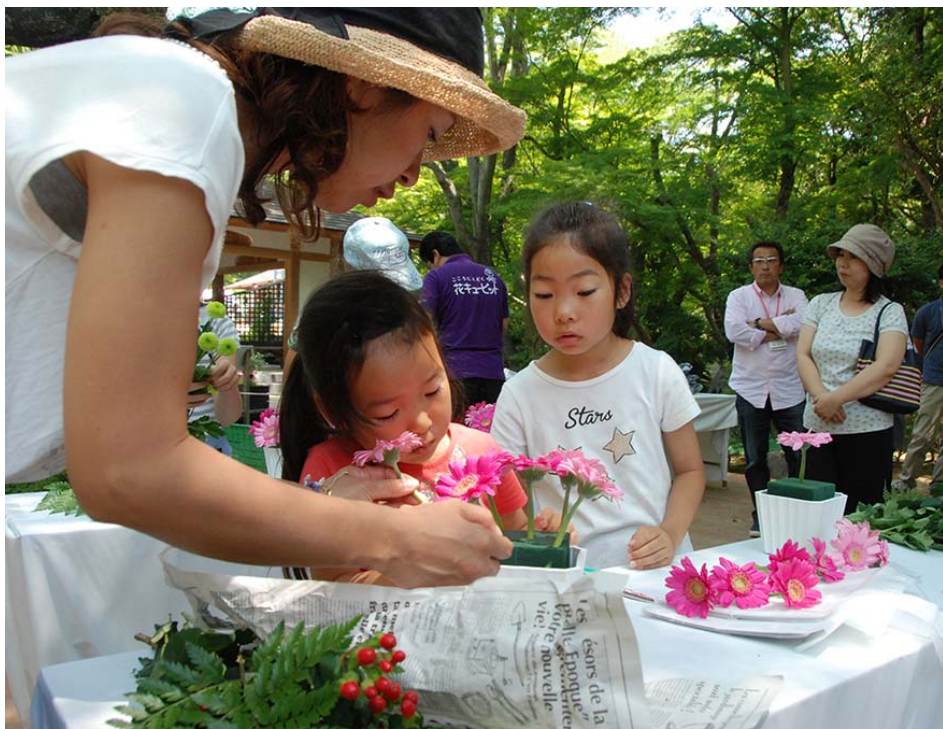
みしま花のまちフェア 5月 28日(土)・29日(日)開催