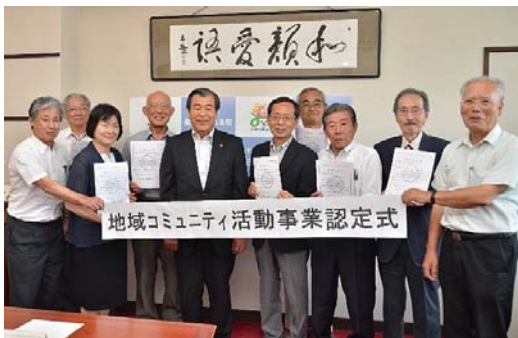
昨年度の認定式の様子