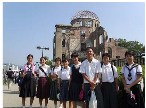
昨年の派遣時の様子