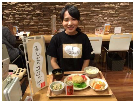
丸の内タニタ食堂（みしまコロケ定食販売時）