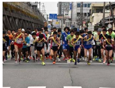
(前回大会のスタートの様子)

平成30年1月7日(日) (小雨決行) 開会式 午前8時30分 (市民体育館) スタート 午前9時30分 (市民体育館南側市道)