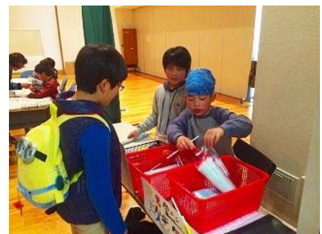
【ゲームコーナーを運営する子どもたち】