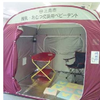
移動式あかちゃんの部屋