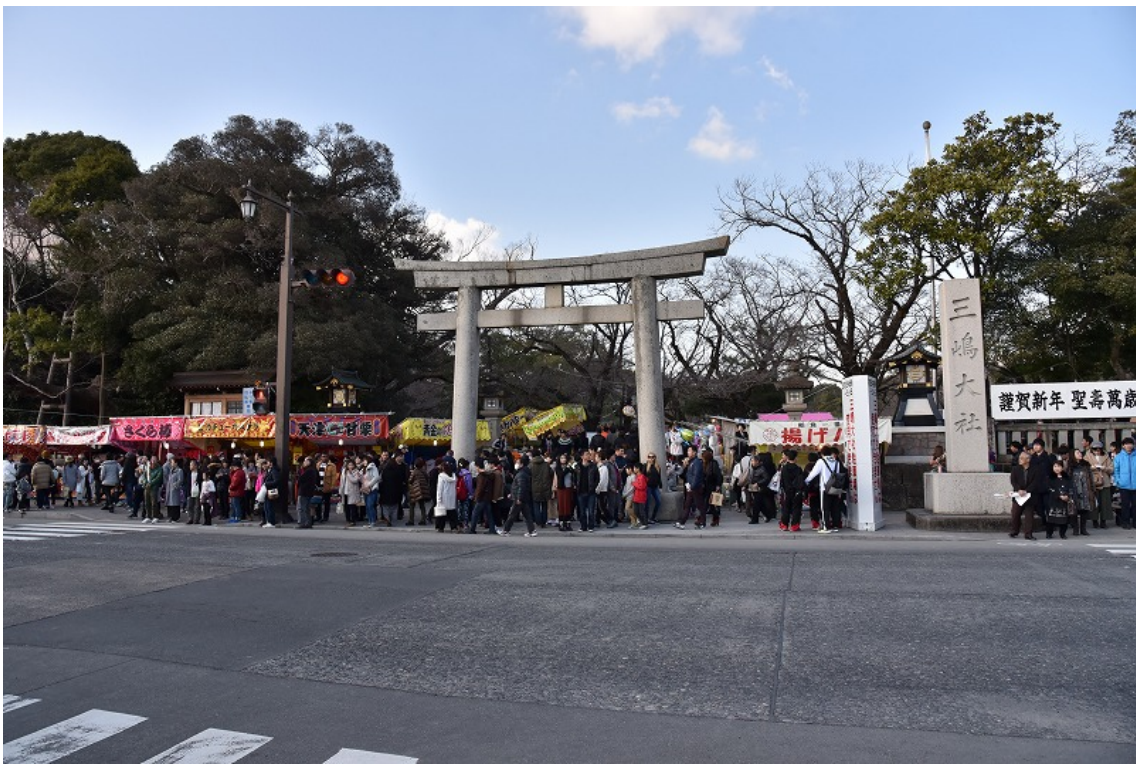
静岡県内で最も参拝者が多い三嶋大社