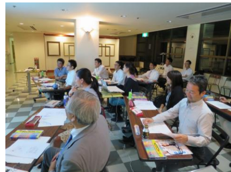
【熱血！デザイン塾@三島 開催風景】

9月23日 第1回 プロジェクトキックオフ（趣旨説明等） 10月5日 第2回 デザイナーとしてのビジョンを作ろう 10月12日 第3回 企業としてのビジョンを作ろう 10月28日 第4回 チームビルディング 11月11日 第5回 コラボ企画を推進 11月25日 第6回 制作テーマの発表 12月9日 第7回 制作 1月27日 第8回 プレゼンテーション