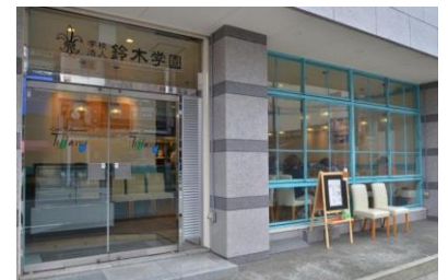
【Tiffany（ティファニー）外観】