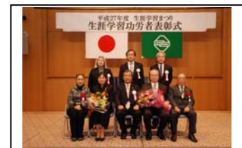
【生涯学習功労者表彰】