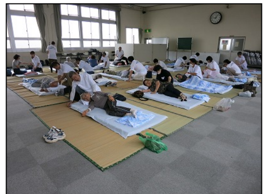
【はり・マッサージ無料治療の様子】

公益社団法人静岡県鍼灸マッサージ師会・三島は、平常時に毎年65歳以上の方を対象に市民の健康維持、増進を図り、公衆衛生の向上に寄与することを目的に「はり・マッサージ無料治療」を年1回実施しています。