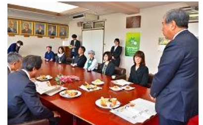
【昨年のお披露目会の様子】

商 品：①ブロッコリーロール ②三島甘藷のクレームブリュレ ③ミシマカロン ④うさぎはっぴーぷりん