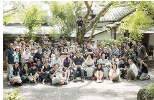
【市民参加型の映画作り（みしまびとプロジェクト）】