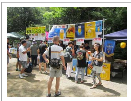
【出店 イメージ写真】