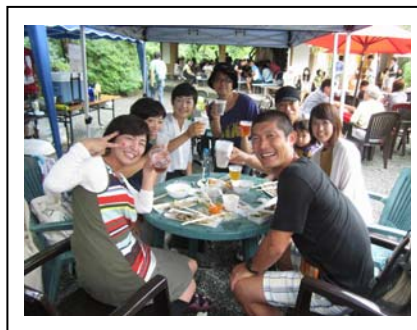
【参加者 イメージ写真】

三島市 産業振興部 楽寿園 〒411-0036 静岡県三島市一番町19番地3号 担当：小川 TEL. 055-975-2570 FAX. 055-975-8555 e-mail : rakujyu@city.mishima.shizuoka.jp