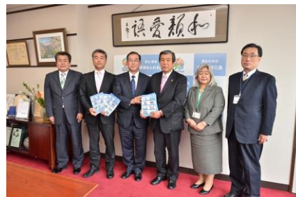
昨年の寄贈式の様子