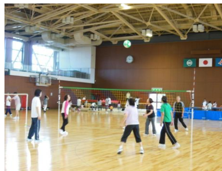
ソフトバレーボールを楽しむ参加者

体育館：ソフトバレーボール、バドミントン、ミニテニス、ユニカール、ペタンク、跳び箱、スポーツチャンバラ、トランポリン、体力測定、卓球、トレーニングルーム、弓道、アーチェリー プール：水泳、ウォーターバルーン（有料）