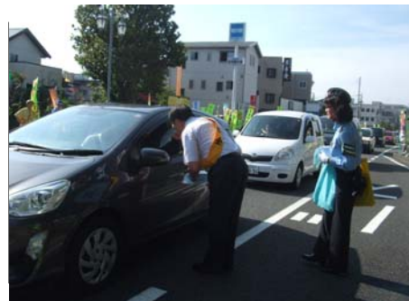
【初日一斉街頭広報でドライバーへ啓発品を配布】

三島市環境市民部地域安全課 〒411-8666 静岡県三島市北田町4-47 担当：柳田・高橋 TEL. 055-983-2651 FAX. 055-981-7720 e-mail : chiiki@city.mishima.shizuoka.jp