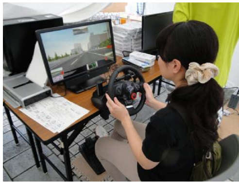
【エコドライブシミュレーター講習の様子】