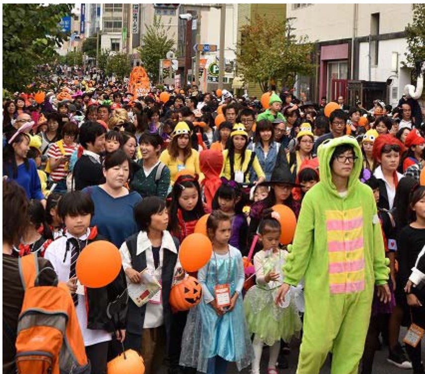
年々規模が拡大！秋最大の子ども向けイベント ハロウィン・パレード in みしま 2017(10月22日)