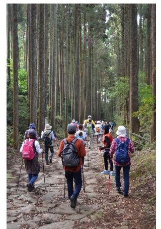
【自然の中歩く参加者たち】

三島市健康づくり課 FAX055-976-8896、メール info@mishima-kenko.club