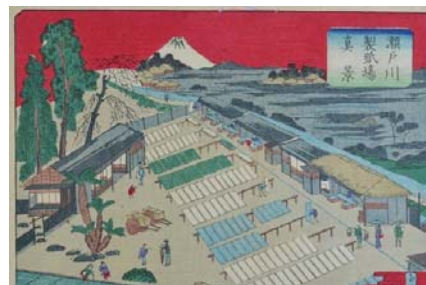
瀬戸川製紙場真景