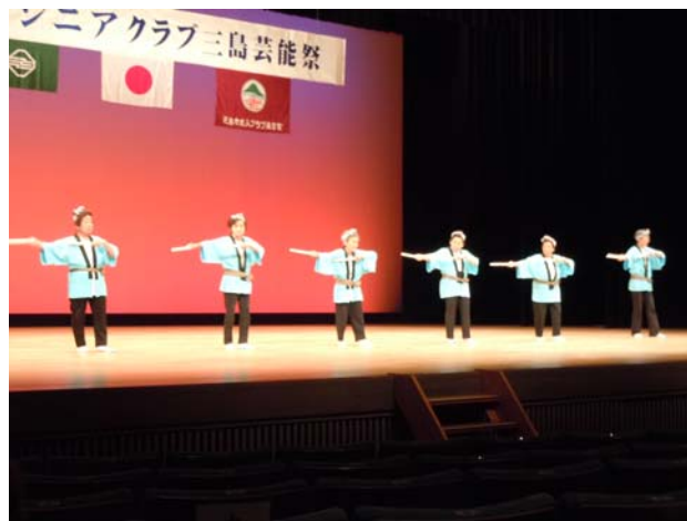
【第52回（昨年度）シニアクラブ芸能祭の様子】

平成29年度 25クラブ 40団体 327人 平成28年度 24クラブ 36団体 311人 平成27年度 23クラブ 35団体 320人