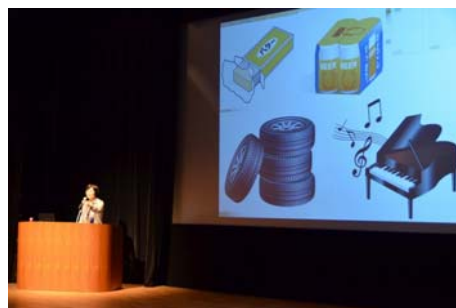
【昨年度の大会風景】

【環境美化推進大会】三島市環境市民部廃棄物対策課 〒411-0000 静岡県三島市字賀茂之洞 4703-94 担当：橋本 TEL. 055-971-8993 FAX. 055-971-8994 e-mail : haitai@city.mishima.shizuoka.jp