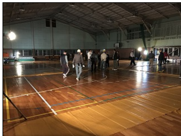
【夜間の避難所開設訓練の様子】