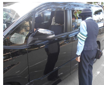
【チャイルドシート着用指導（秋）】