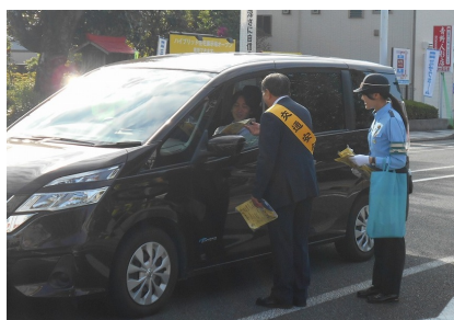
【事前一斉街頭広報（秋）】