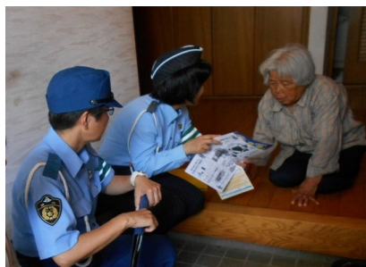
【二人三脚高齢者訪問（夏）】