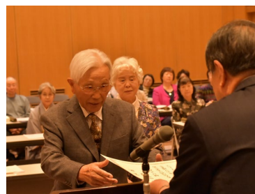
【文芸三島41号表彰式の様子】

三島市産業文化部文化振興課 〒411-8666 静岡県三島市大社町1-10 担当：佐藤 良 平 TEL. 055-983-2756 FAX. 055-981-7720 緊急時連絡先（担当携帯） e-mail : bunka@city.mishima.shizuoka.jp