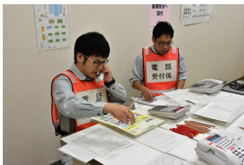
【市からの状況付与】