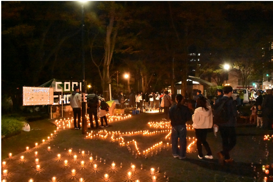
キャンドルアートが幻想的に会場を装飾「キャンドルナイトみしま」 (12月7日開催)