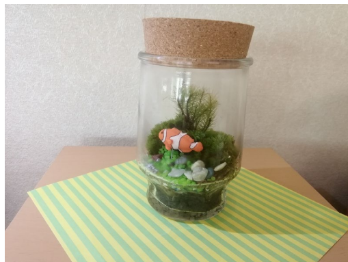
【自分だけの小さな世界が楽しめる苔テラリウム】

テラリウムとは、陸上の生物(主に植物や小動物)をガラス容器などで飼育、栽培する技術のこと。