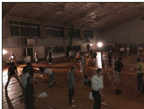
【夜間の避難所開設訓練の様子】