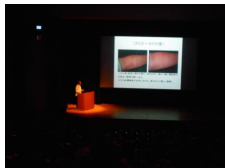
【昨年度の大会風景】

【環境美化推進大会】三島市環境市民部廃棄物対策課 〒411-0000 静岡県三島市字賀茂之洞 4703-94 担当：江間 TEL. 055-971-8993 FAX. 055-971-8994 e-mail : haitai@city.mishima.shizuoka.jp