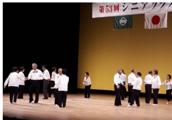
【第53回（昨年度）シニアクラブ芸能祭の様子】

平成30年度 26クラブ 39団体 377人 平成29年度 25クラブ 40団体 327人 平成28年度 24クラブ 36団体 311人