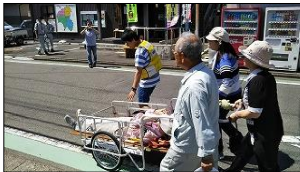
【昨年度の避難訓練の様子】