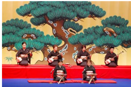
【第56回三島市民芸術祭の様子】