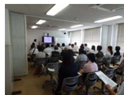
矯正施設訪問(過去の様子)