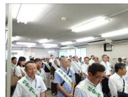
街頭宣伝出発式(過去の様子)