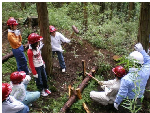
【森の小さなダムづくり】