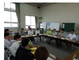
ケース研究会(過去の様子)