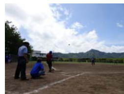
スポーツ交流大会(過去の様子)