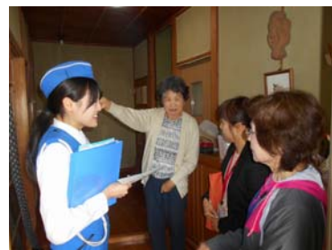
【二人三脚高齢者訪問】