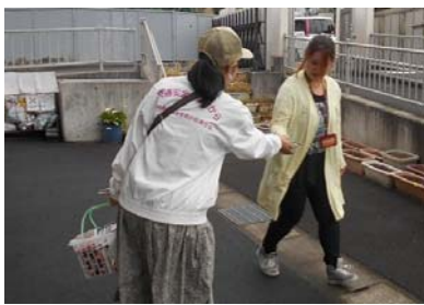
【シートベルトチャイルドシート着用推進】