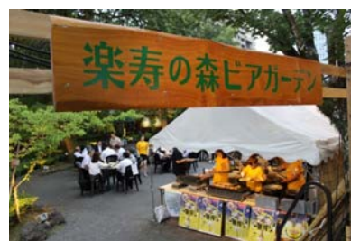
【楽寿の森 ビアガーデン】