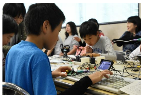
【電子工作とプログラミング教室】