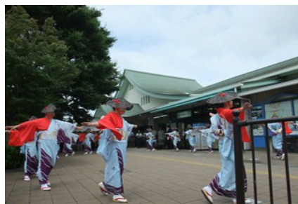
富士登山道開山式の様子

運行期間 7月8日（月）から9月8日（日）まで（予定） 運行会社 富士急シティバス（株） 電話：055-921-5367 所要時間 約2時間（三島駅から富士宮口五合目までの片道）