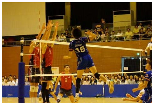
【2015年9月 東レアローズとのエキシビションマッチ】

ホストタウンとは、東京2020オリンピック・パラリンピックの開催を契機に、地方公共団体が大会参加国との人的・経済的・文化的な相互交流を図り、地域活性化などを進めることを目的としたもので、国(内閣官房)が推進している制度。 三島市は、平成28年1月に「アメリカ」のホストタウンになっています。