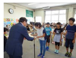
ポスター表彰式(過去の様子)

※昨年度は応募総数1,070点のうち、 特別賞15点、入選22点、佳作44点を表彰(81点)