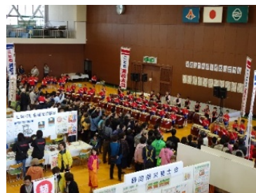
【三島市民体育館開催時の館外、館内、ステージイベントの様子】