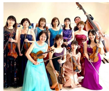
【三島ゆうゆう祝祭管弦楽団 Strings】