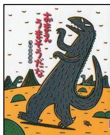
『おまえうまそうだな』 宮西達也/作絵 ポプラ社