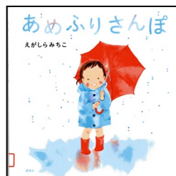
『あめふりさんぽ』 えがしらみちこ/作 講談社