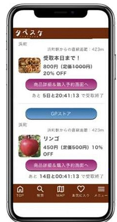
▲「タベスケ」アプリ画面（例）

令和6年10月1日～令和7年9月30日 ※9月下旬頃、参加店舗等の詳細情報をお知らせします。