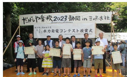
【過去の表彰式の様子】