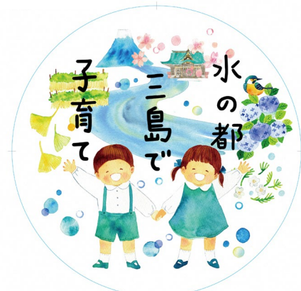
【イメージ図（ヘッドマーク）】