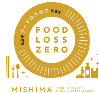
▲ステッカーデザイン