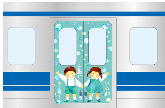
【イメージ図（車両ドア部）】