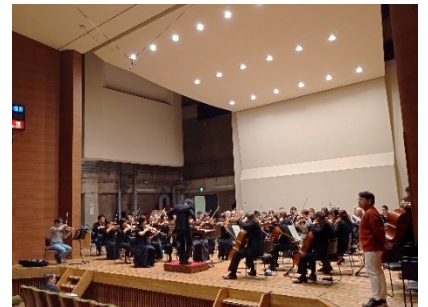
【先日の様子（指揮者クリニック）】

令和6年12月15日（日）@静岡県健康福祉交流プラザ 伊豆ジュニアブラスやアマチュア演奏家にトランペットの指導を行いました。