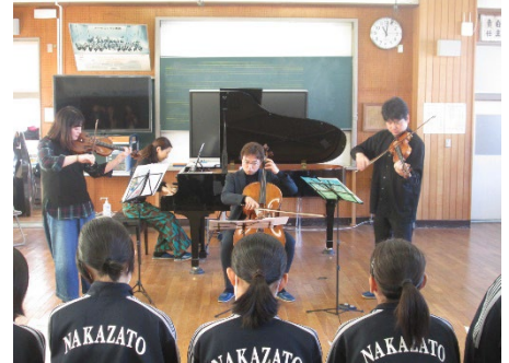
【先日の様子（中郷中訪問コンサート）】