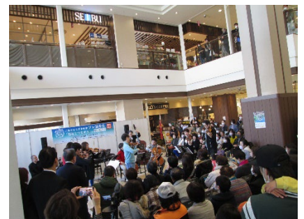
【昨年度の様子(日清プラザ)】