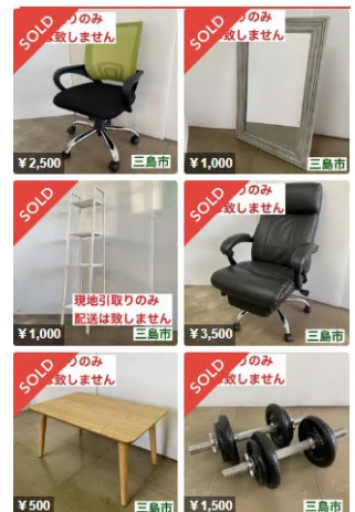
▲出品された商品（例）