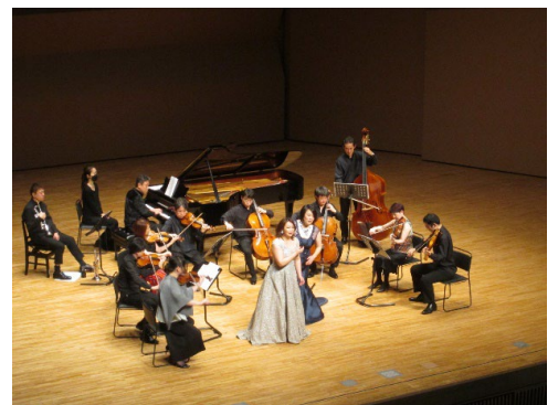
【過去の様子(せせらぎコンサート)】

せせらぎコンサート出演者が 13:45 からの正式参拝の後、三嶋大社舞殿で演奏を奉納します。