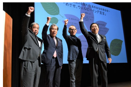
【めざせ、ウェルビーイング宣言】