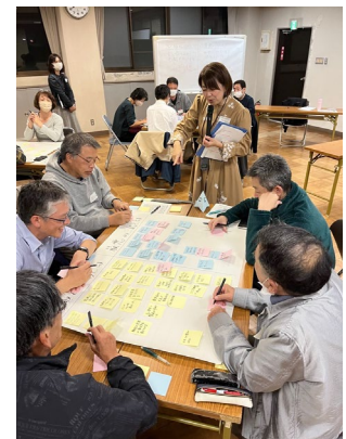
【ミーティングの様子】