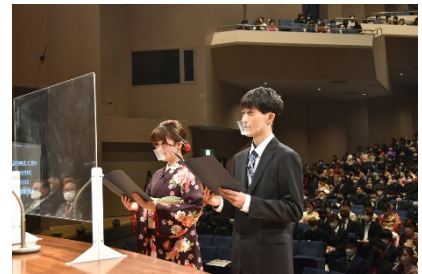
【昨年の二十歳の誓い】