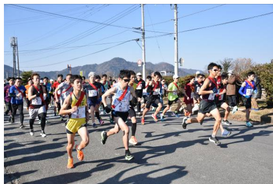
【前回大会のスタートの様子】