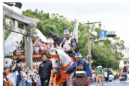
【多くの人で賑わった「三嶋大祭り」】