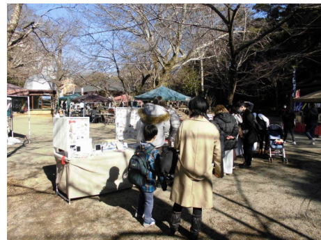
【「三島ベジタブルフェス」前回の様子】

内容 お野菜たっぷり料理やナチュラルな雑貨など、お野菜が揃う野菜のお祭りです。ケーキ・クッキーなどのスイーツやバーガーも動物性たんぱく質不使用! おいしく健康的なひとときを楽寿園で過ごしませんか?