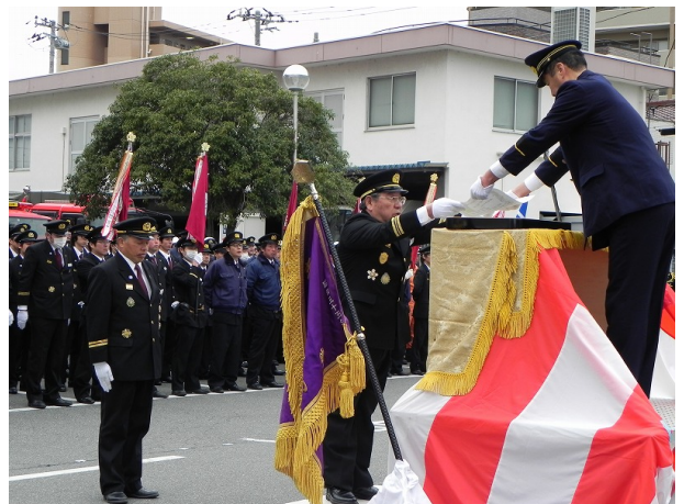
【式典の様子（昨年度）】

天候による式典会場等の問い合わせは、当日午前8時以降に富士山南東消防本部三島署へお問い合わせください。（電話 972-5800）