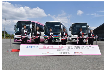
【「三島羽田シャトル」運行開始】