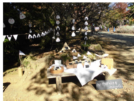
【「おにぎりが好き」前回の様子】