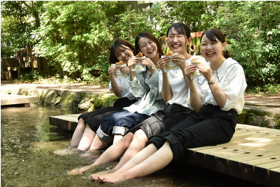
今年で15周年！「みしまコロッケ」