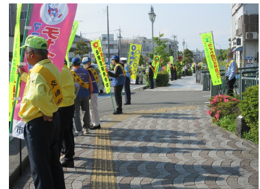
▲初日一斉街頭広報（令和5年春）

日時 令和5年7月11日（火） 午前7時30分～8時 内容 運動開始を周知する「初日一斉街頭広報」を各種交通関係団体と協力して行います。市役所前では、三島警察署、交通関係団体、市民関係団体、三島市職員の合計約150名で、のぼり旗を掲出してドライバーや歩行者に交通安全の啓発を行います。