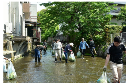
【令和元年度の清掃風景】