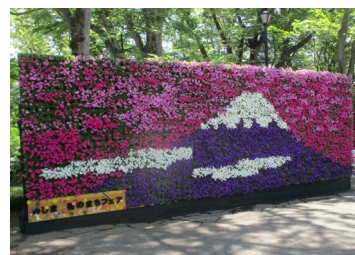
【過去開催時の愛染院跡・白滝公園の花飾り】