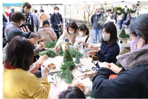
【令和2年度のコーヒーとめがねの様子】