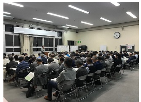
【令和元年度の様子】