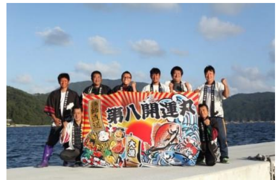
山田町第八開運丸の皆さん