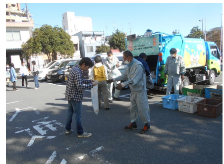
【昨年度の実施風景】