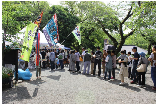
【令和元年度の山田港開運市の様子】

当日は、入園前の検温、アルコール消毒液の各所設置、マスクの着用の徹底等を行い、新型コロナウイルス感染拡大防止の対策をしてイベントを実施します。