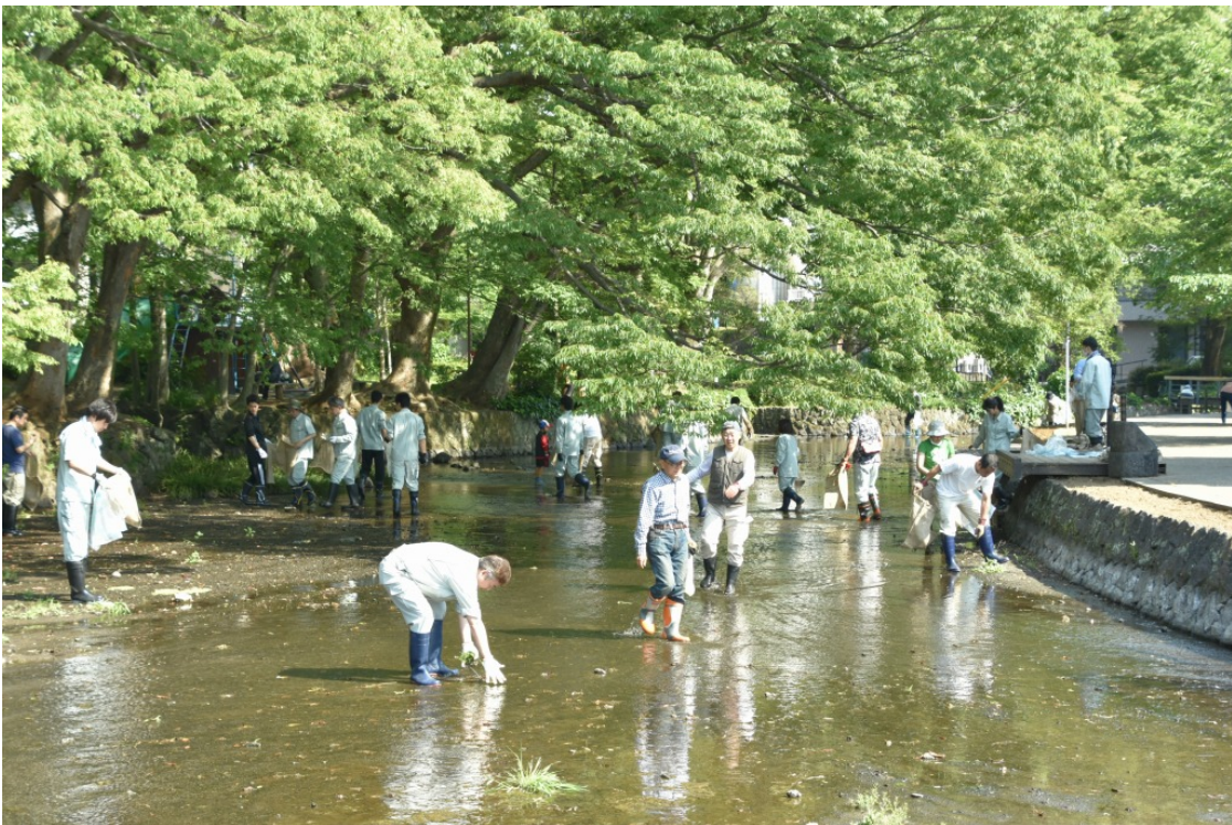
三島の川をきれいにする奉仕活動 [5月9日(日)]