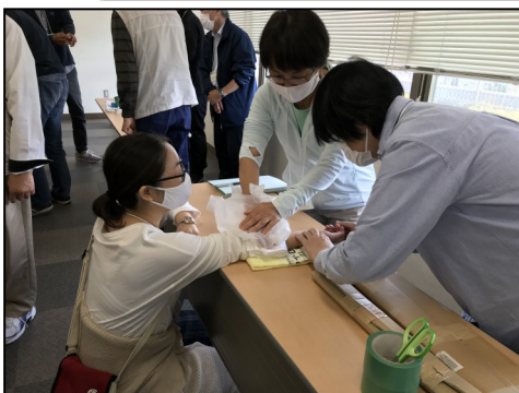
身近なものを使った応急手当