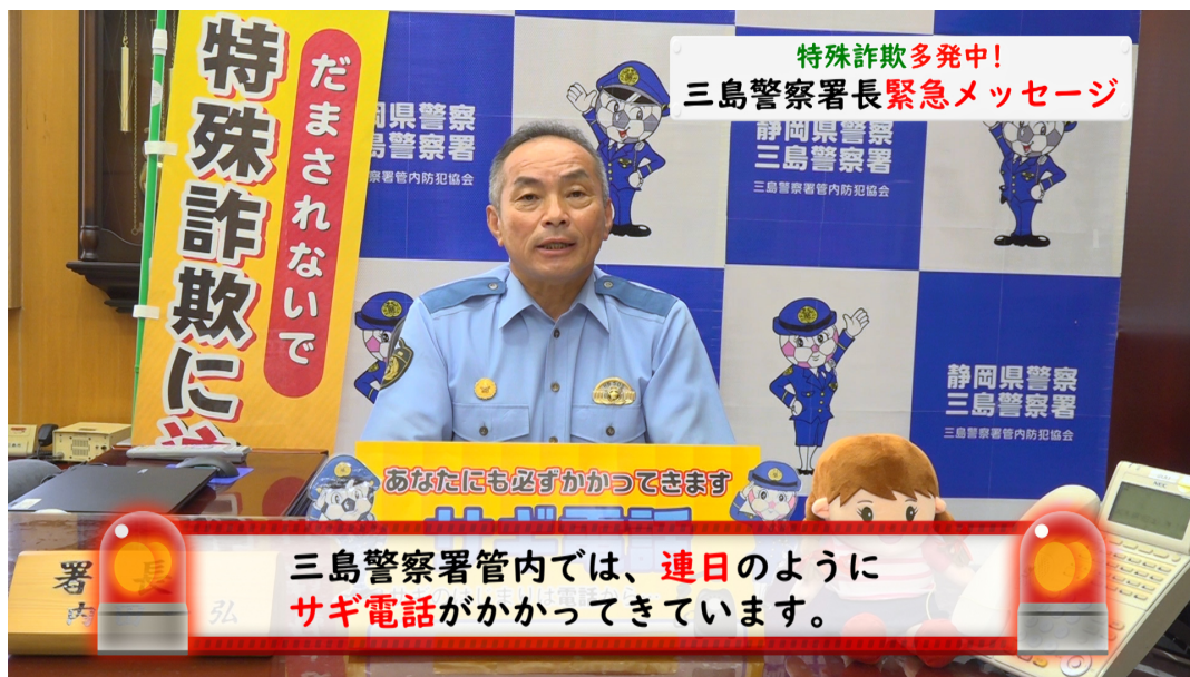
三島警察署管内「サギ電話多発中！」（三島市公式 YouTube チャンネル配信） [三島警察署・三島市が連携した詐欺被害防止の取り組み]