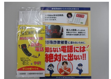
▲啓発用チラシ及びマスク