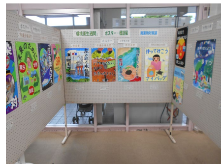
【昨年度の作品展示】