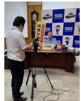
▲署長からのメッセージ撮影