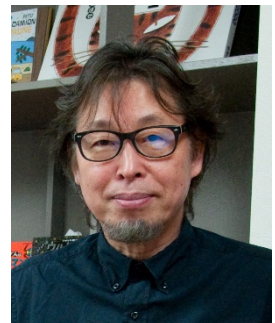
絵本作家 宮西達也さん

平成29年5月には三島市中央町の一角に「TATSU'S GALLERY (タツズギャラリー)」をオープン。ギャラリーには絵本原画やオブジェなどが展示されているほか、絵本やグッズの販売も行い、市内の方はもちろん、県外からも多くの方が訪れる人気スポットとなっている。