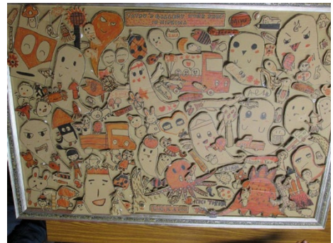
参考：段ボールアート完成写真