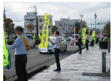
▲初日一斉街頭広報（令和4年秋）

内容 運動開始を周知する「初日一斉街頭広報」を各種交通関係団体と協力して行います。市役所前では、三島警察署、交通安全協会三島地区支部交通安全指導員、警察署関係団体、市民関係団体、三島市職員の合計約140名で、のぼり旗を掲出してドライバーや歩行者に交通安全の啓発を行います。