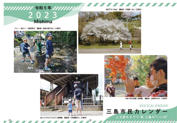
令和5年版カレンダー表紙

平成30年版 みしまで出会ったハピネスシーン 平成31年版 今伝えたい箱根西麓の景色 令和2年版 私のイチオシの三島 令和3年版 未来に残したい三島 令和4年版 みつけた！三島の“いいね”