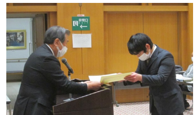
【文芸三島44号表彰式の様子】