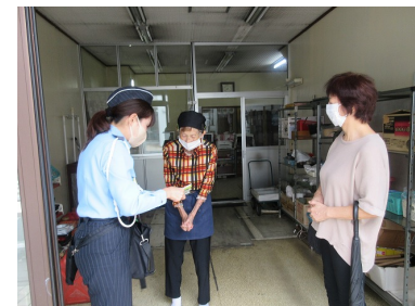
▲二人三脚高齢者訪問（令和4年秋）

内容 交通安全指導員、民生委員、市職員が高齢者宅を訪問して、個別に交通安全を呼びかけます。