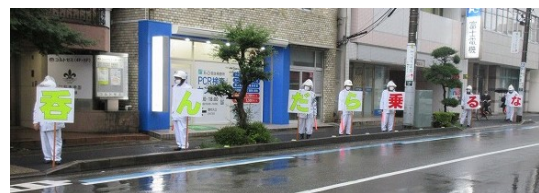
▲「飲酒運転等危険運転根絶の日」街頭啓発

内容 三島警察署員、交通安全指導員、市職員が、三島広小路駅周辺の飲食店を訪れて啓発品を配布し、店内で飲酒運転根絶のための呼びかけをしていただくよう依頼します。また、三島広小路駅周辺でのぼり旗を掲出し、通行車両や歩行者に啓発を行います。