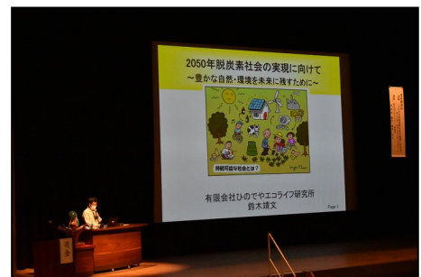
【昨年度の大会風景】

【環境美化推進大会】三島市環境市民部廃棄物対策課 〒411-0000 静岡県三島市字賀茂之洞 4703-94 担当：江間 TEL. 055-971-8993 FAX. 055-971-8994 e-mail: haitai@city.mishima.shizuoka.jp