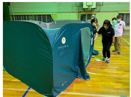
【ワンタッチパーティション設置の様子】