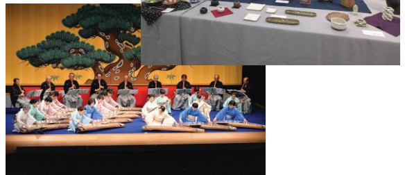
【過去の三島市民芸術祭の様子】