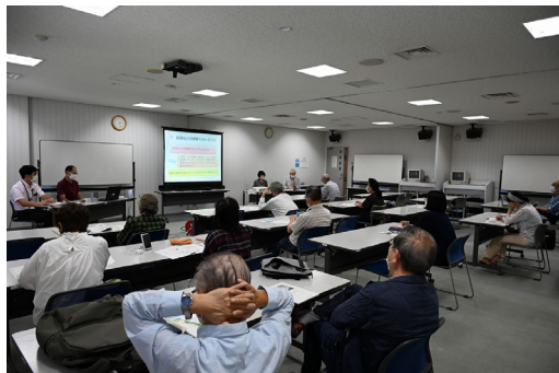
【令和3年度の講座の様子】