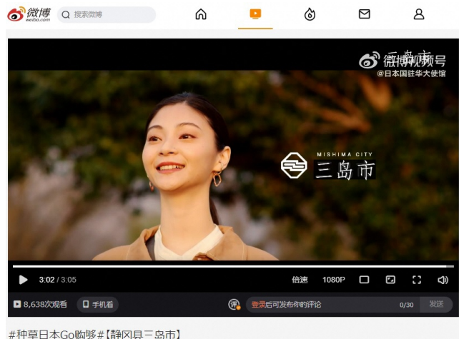
【ウェイボー配信画面】