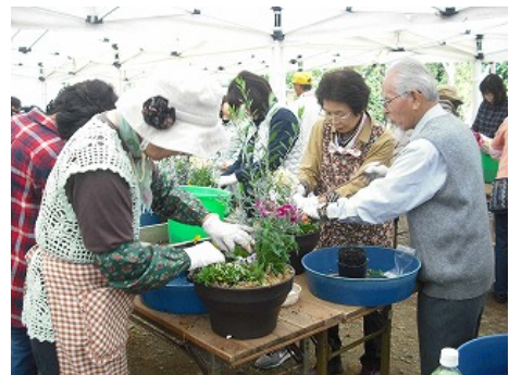
【 昨年の開催風景 】

今年度も申込み開始から多くのご連絡をいただき、市民の皆様の関心の高さが伺えます。