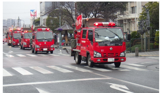
【 防火パレードの様子 】