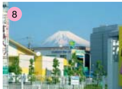
8 イトヨーカドー（日清プラザ）前