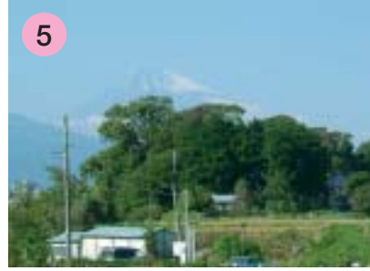
5 新町橋（しんまちばし）