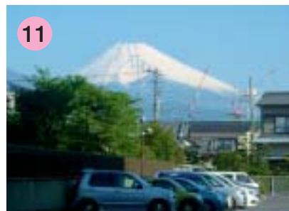
11 南町13階マンション南側