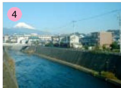
4 下神川橋（しもかがわばし）