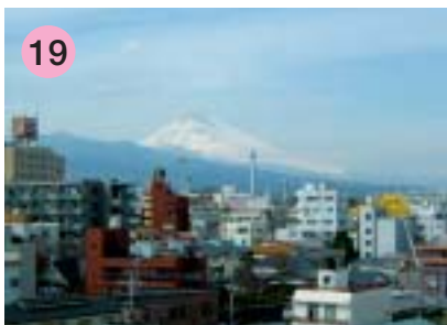
19 生涯学習センター5階（月曜日休館）