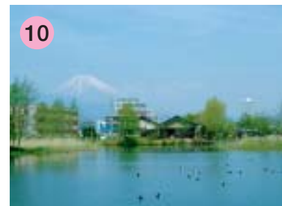
10 中郷温水池（なかざとのおんすいち）