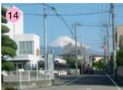
14 メディカルセンター付近