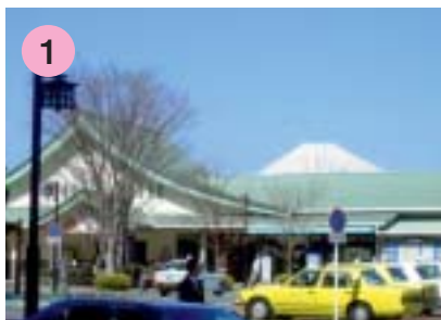
1 JR三島駅南口広場前