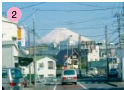
2 大宮町3丁目交差点