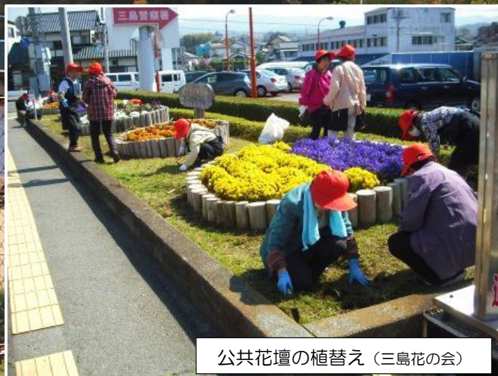
公共花壇の植替え (三島花の会)