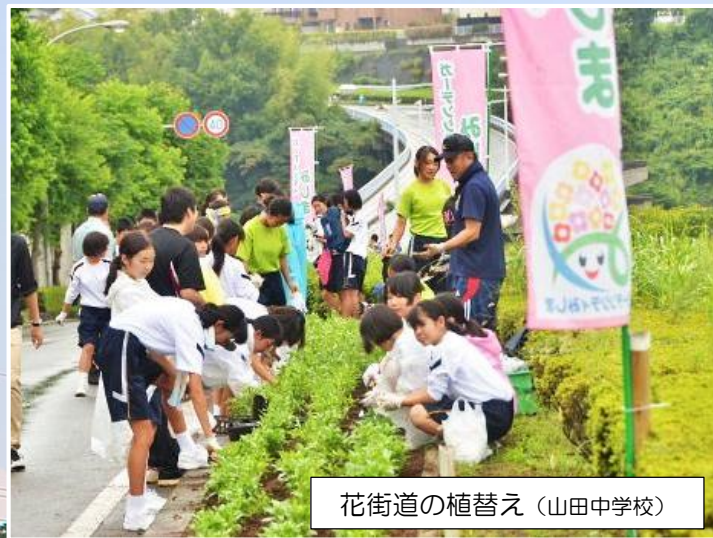
花街道の植替え (山田中学校)