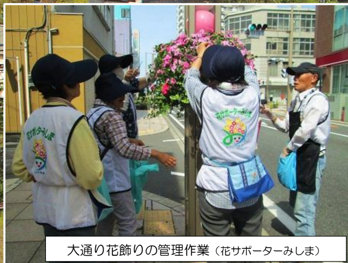
大通り花飾りの管理作業 (花サポーターみしま)