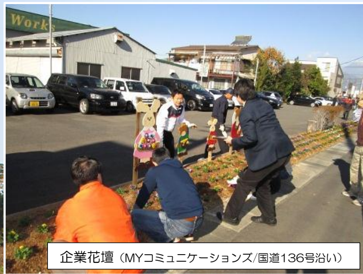
企業花壇 (MYコミュニケーションズ/国道136号沿い)