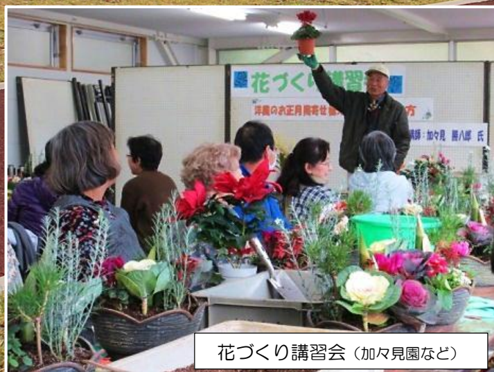
花づくり講習会 (加々見園など)