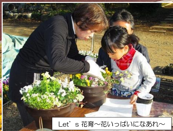
Let's 花育～花いっぱいになあれ～