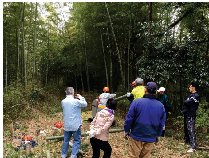
写真 5-4 竹破砕機講習会の様子

さまざまな影響が懸念される放置竹林の対策のため、竹破砕機の講習会の開催や貸出しを実施し市民の意識向上を図り、併せて竹材の有効利用など、総合的な対策の検討をしていく。