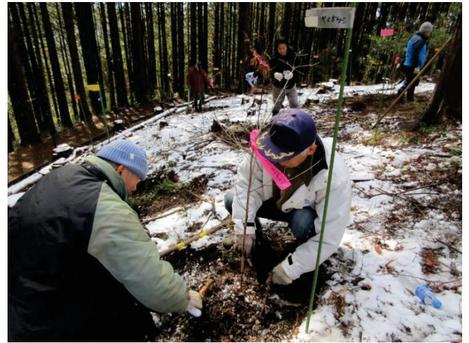
写真 5-4 植林体験の様子