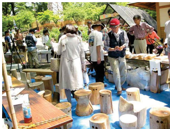
写真 5-2 木工作品販売の様子