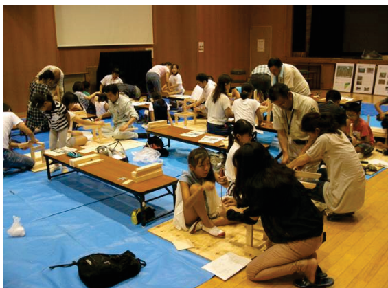
写真 5-1 親子木工教室の様子

NPO 法人三島フォレストクラブと連携し、市内の森林で間伐された木材を使った木工教室を開催することや木工作品をイベントなどで展示するなど、森林資源の活用に対するPRを積極的に行っていく。