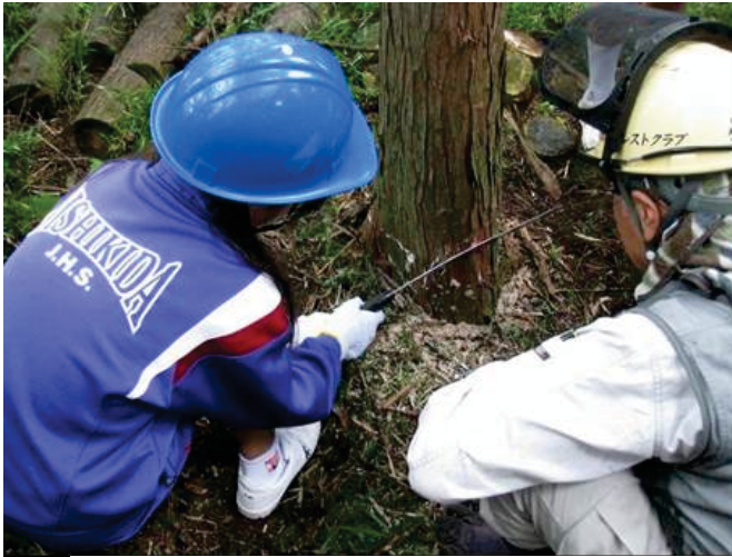
写真 5-3 間伐体験の様子