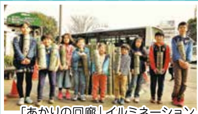
「あかりの回廊」イルミネーション