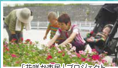
「花咲か市民」プロジェクト