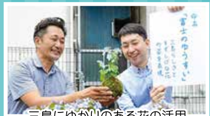
三島にゆかりのある花の活用