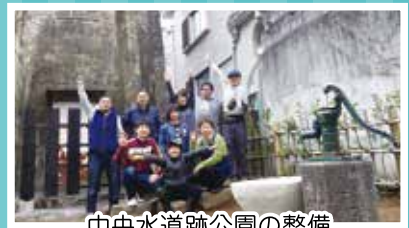
中央水道跡公園の整備