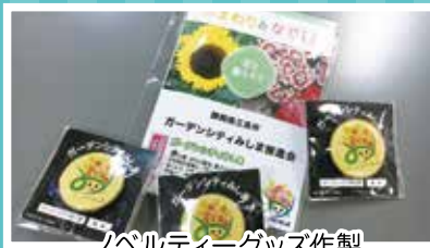
ノベルティーグッズ作製