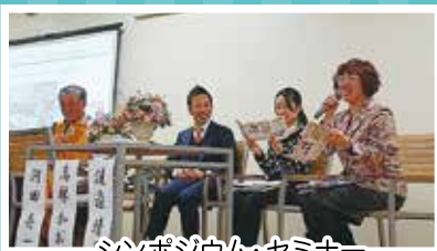
シンポジウム・セミナー