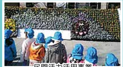
民間活力活用事業