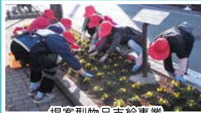
提案型物品支給事業