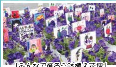
「みんなで飾ろう鉢植え花壇」