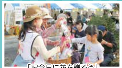
「記念日に花を贈ろう」