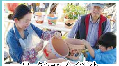
ワークショップ・イベント